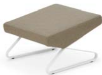
Mimikri beige beige