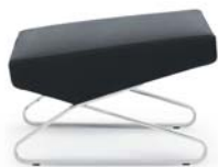
Leder schwarz leather black

Estructura de acero cromado o microestructura de laca pulverizada. Acolchado: madera, poliuretano en diferentes densidades y espuma. Patillas intercambiables de fieltro o plástico. Tapicería de tela o cuero. Detalles y colores ver lista de precios.