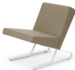
SATYR ARMCHAIR 2008