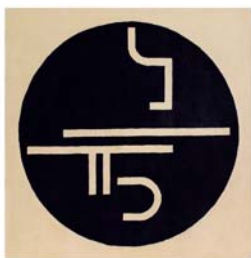
ST. TROPEZ 1925 - 1935