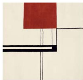
WENDINGEN 1925 - 1935