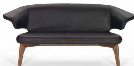
MUNICH LOUNGE CHAIR 2009