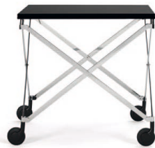
Chrom, Tischplatte Fenix Chrome, tabletop Fenix