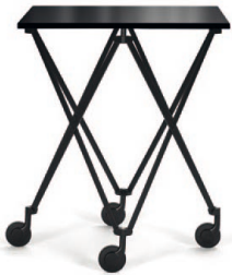
Schwarz, Tischplatte Kristallglas Black, tabletop crystal glass

Mesa auxiliar sobre ruedas, de altura regulable en continuo. Estructura de acero con revestimiento pulvimetalúrgico en negro con tablero de vidrio de cristal, lacada en negro o cromada con tablero de Fenix HPL en negro mate.