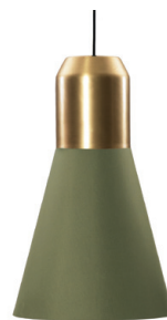
Messing, Stoff grün Brass, fabric green