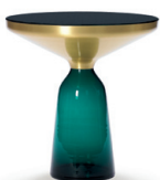
BELL SIDE TABLE 2012