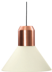
Kupfer, Stoff weiß Copper, fabric white

Elemento de iluminación: máx. 75W / 230V Halopar 30 (E27 / ES)