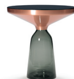
BELL SIDE TABLE COPPER 2013 Special Edition