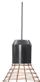
Metall grau lackiert, Korb verkupfert Grey-lacquered metal, cage copper-plated