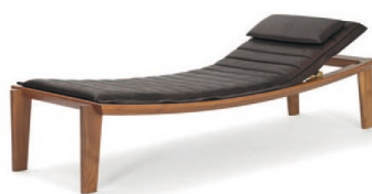
Nussbaum, Leder Chocolate Walnut, leather chocolate