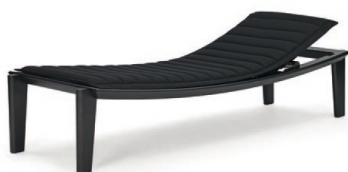
Eiche schwarz gebeizt, Stoff schwarz Oak black-stained, fabric black