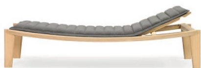
Eiche natur, Stoff grau Oak, fabric grey

Estructura de madera maciza, barnizada en color natural o negro, lacado transparente. Los componentes metálicos son de latón macizo sin lacar o cromados en negro. Acolchado de poliuretano con lana de poliéster. Tapicería de tela o piel. Sujeción del cojín con broches automáticos en el sector de la cabeza y los pies. Cabecera ajustable en altura en tres niveles. Patines de plástico blancos antideslizantes.