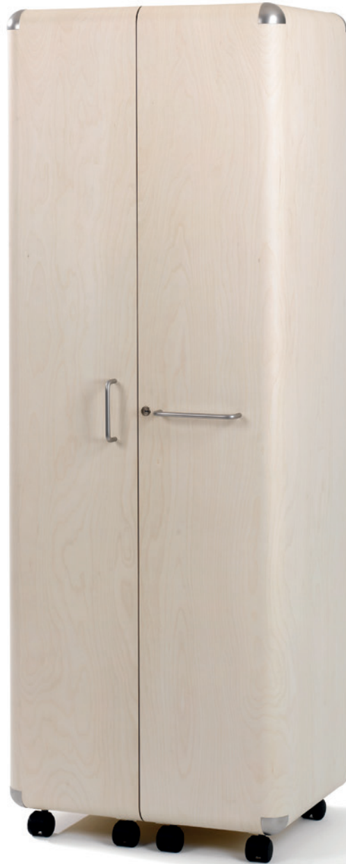
Shell Ubaldo Klug