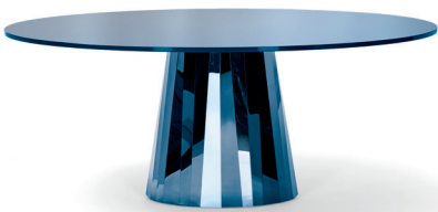
Saphir-blau, Tischplatte Glas Sapphire blue, tabletop glass