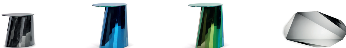
PLI SIDE TABLE LOW 2016