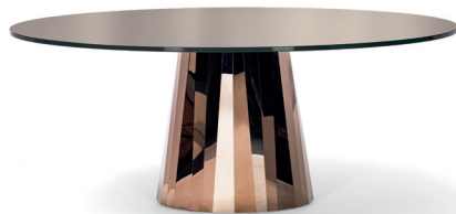
Pyrit-bronze, Tischplatte Glas Pyrite bronze, tabletop glass