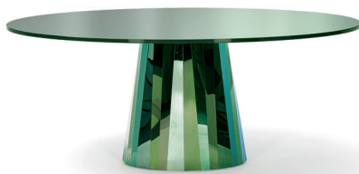
Topas-grün, Tischplatte Glas Topas green, tabletop glass