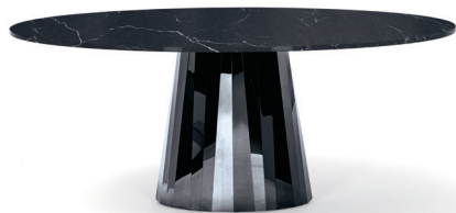
Onyx-schwarz, Tischplatte Marmor Onyx black, tabletop marble

Mesa. Pie de chapa plegada de acero inoxidable con pulido de gran brillo en diversos colores. La coloración se ha aplicado utilizando un procedimiento especial. Tablero ovalado de cristal, con lacado brillante. O tablero ovalado demármol, pulido e impregnado. Tacos de fieltro negros, de altura regulable. Para más detalles y colores, ver lista de precios.