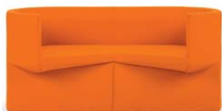
Divina orange orange

Sofá de dos plazas. Estructura de tubos de acero con bandas de goma y poliuretano rígido. Acolchado de poliuretano con poliéster. Tapicería de tela o cuero. Detalles y colores ver lista de precios.