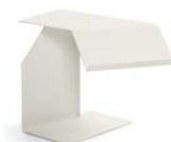
DIANA F 2002