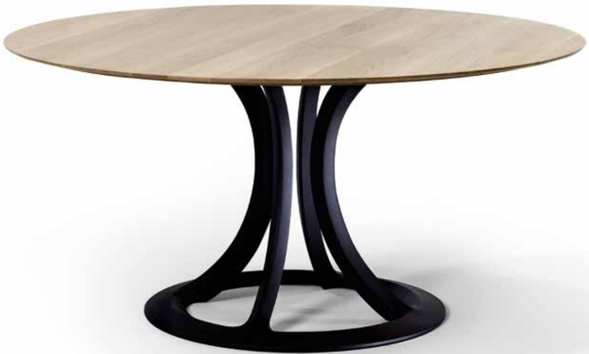
Arcos Koni Ochsner / Werkdesign